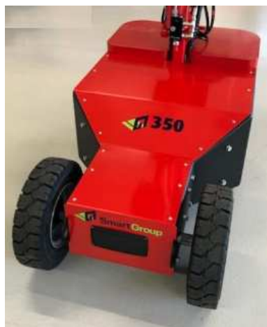
Roues Semi Tout Terrain