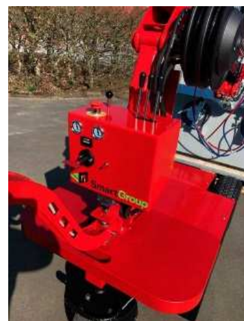
Unité centrale regroupant les Commandes