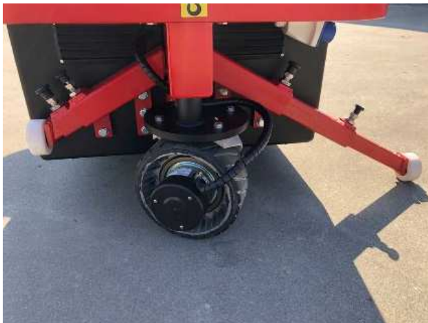
Stabilisateurs Télescopiques Roue Motrice Arrière