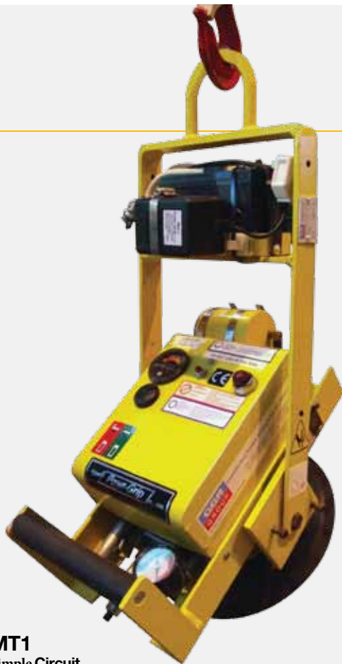
MT1 Simple Circuit