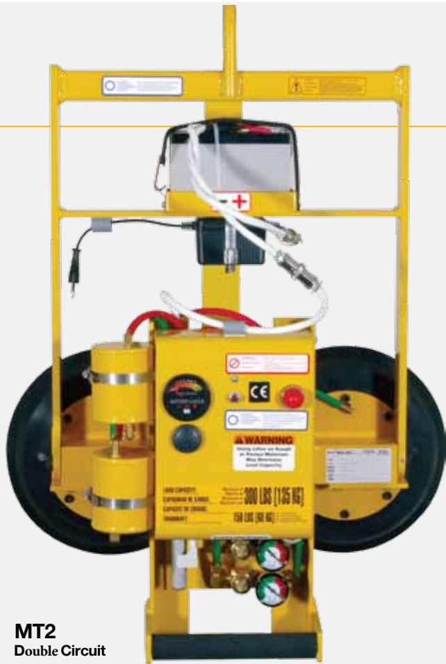
MT2 Double Circuit