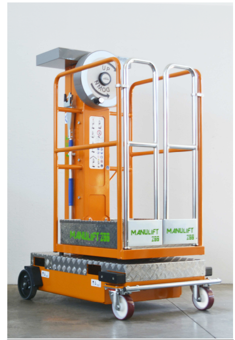
Châssis 4 Roues en option avec Barre de freinage à Pied en Acier Inoxydable

Peinture spéciale ( Quantité mini 10 machines - Réf. RAL à fournir )